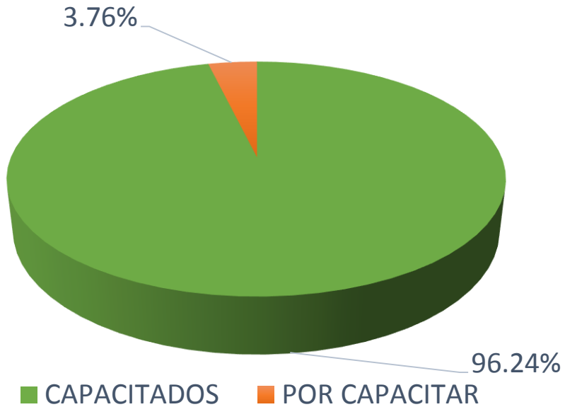
% PORCENTAJE DE SERVIDORES PÚBLICOS CAPACITADOS